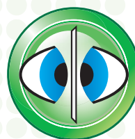
Escáner por ambos lados