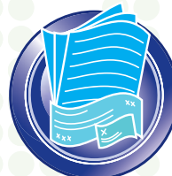
Escáner de documentos de alta velocidad