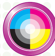
Escáner a color